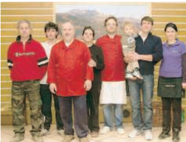
UN MODELLO La cooperativa Valle dei Cavalieri di Succiso è un modello studiato anche all'estero perché ha permesso la rinascita di un borgo destinato allo spopolamento e al degrado. A sinistra, i soci. A destra, il paese e la produzione di formaggio.